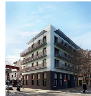
EDIFICI PLURIFAMILIAR EN TESTERA DE 10 HABITATGES I TRASTERS Av. Marquès de Mont-roig, 1-5. 08912. Badalona

Les característiques de l'habitatge i les seves instal·lacions estaran supeditades a les exigències de les normatives vigents, així com a les solucions tècniques determinades per la direcció facultativa. Tot això pot donar lloc a possibles modificacions d'aquest plànol e infografies. El mobiliari, vegetació i elements de decoració representats són merament orientatius i no estan inclosos en els habitatges. Aquest plànol no té validesa legal.